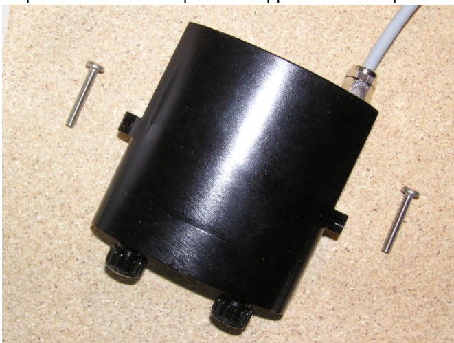
Boîtier à accus