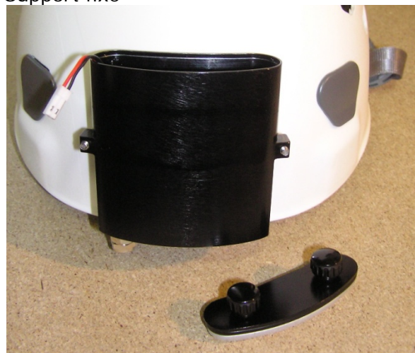
Boîtier à accus monté