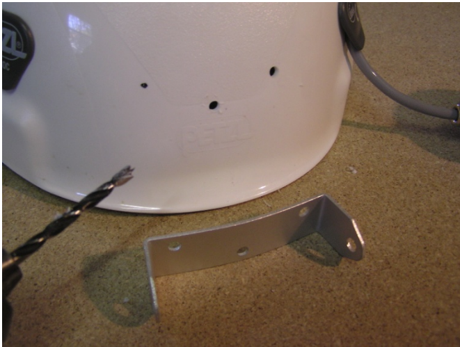
Préparation des trous pour le support de la lampe

Nous recommandons de faire passer le câble de lampe à l'intérieur du casque. Eventuellement les deux guides de plastique fournis peuvent être utilisés pour fixer le câble à l'extérieur le long du rebord (Dans ce cas veuillez bien considérer le dernier point de ce guide!).